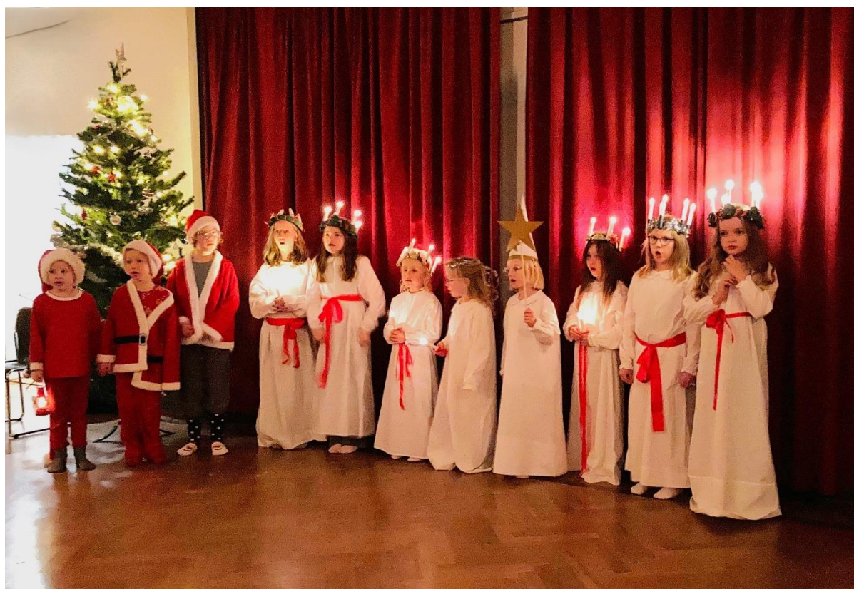
Domkyrkans barnkör lussade vid dansavslutningen 4 december.