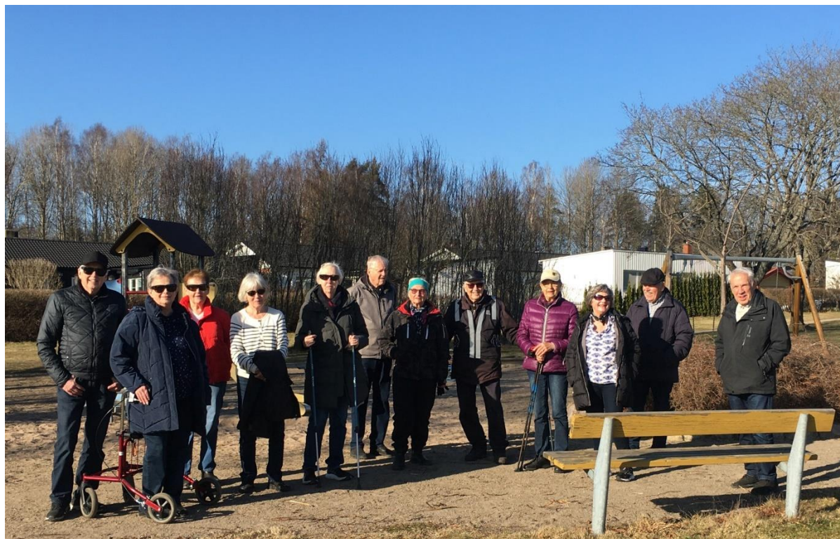
Från promenaden den 16 mars, lekparken vid Vretvägen