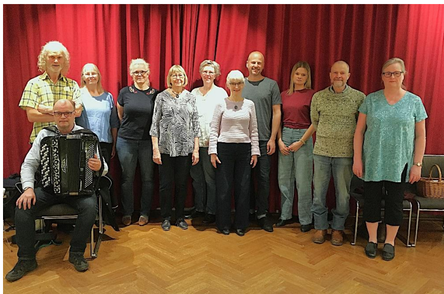
Kursdeltagare den 23 mars.

Eftersom flera ville hänga på, fortsätter grundkursen även våren 2025 vid 6 tillfällen. Här ges möjlighet att lära sig dansa de magiska polskorna. Eller fräscha upp sina kunskaper för den som dansat tidigare.