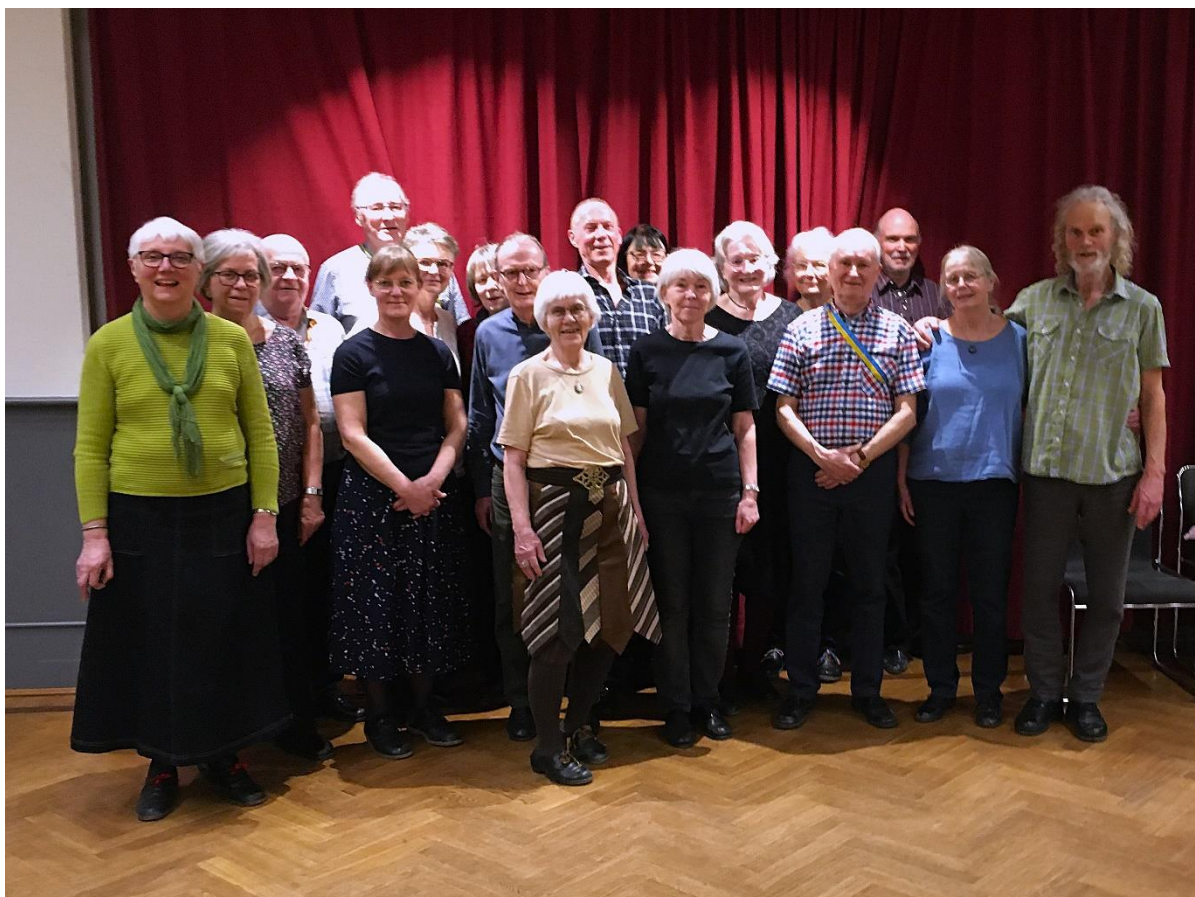
Gruppen som dansade den 16 mars

Polskedanserna startade redan den 19 januari.