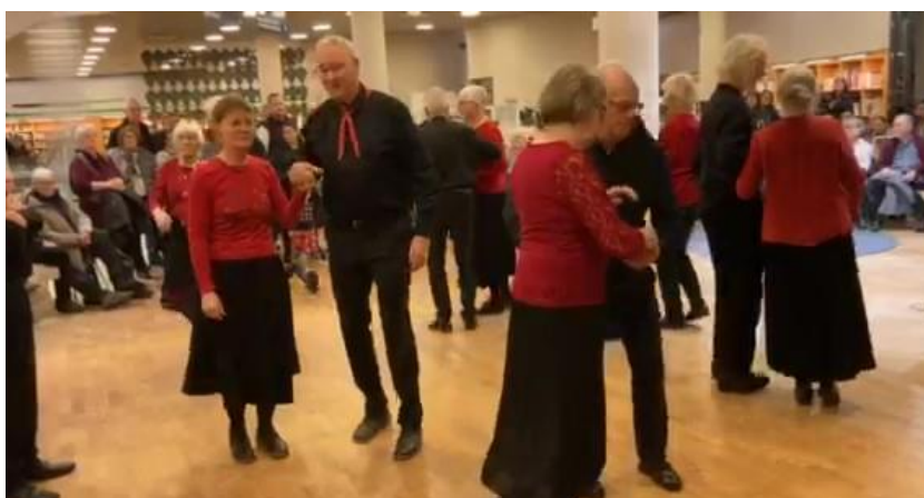
Dans på biblioteket under Kulturnatten