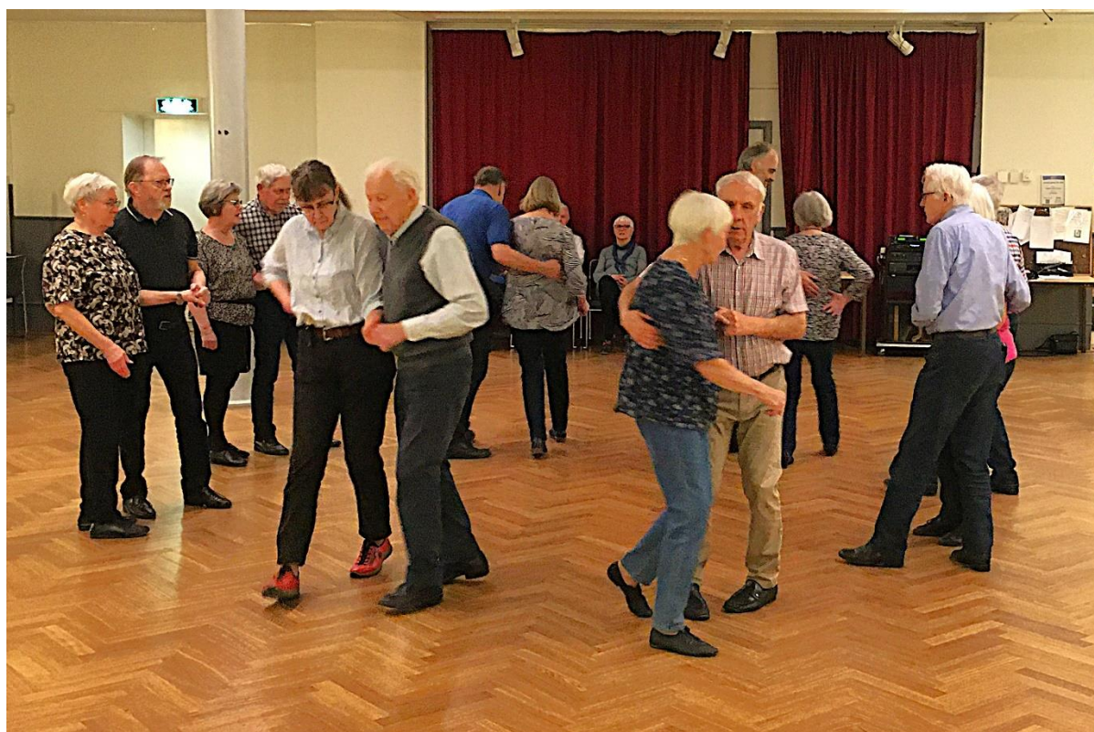
Torsdagskvällen den 20 mars dansades bl.a. Södervidingekadrilj.