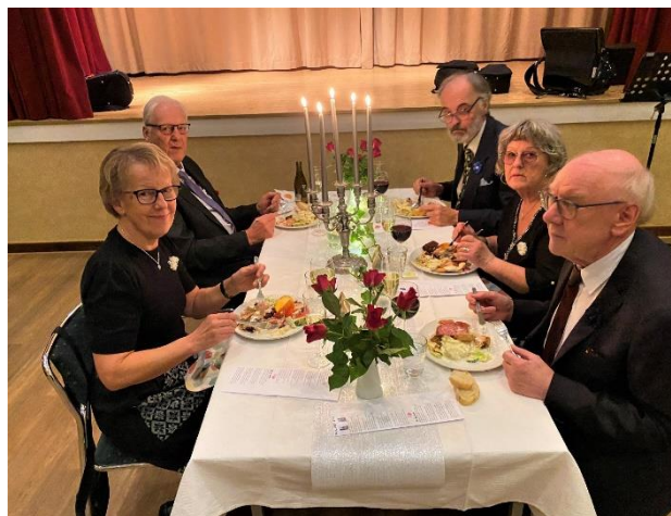
Jubilarerna vid nollfesten 2024

Feststämning var det under hela kvällen, alla var nöjda och glada. Det blev mycket sång och sedan dans till våra egna duktiga spelmän.