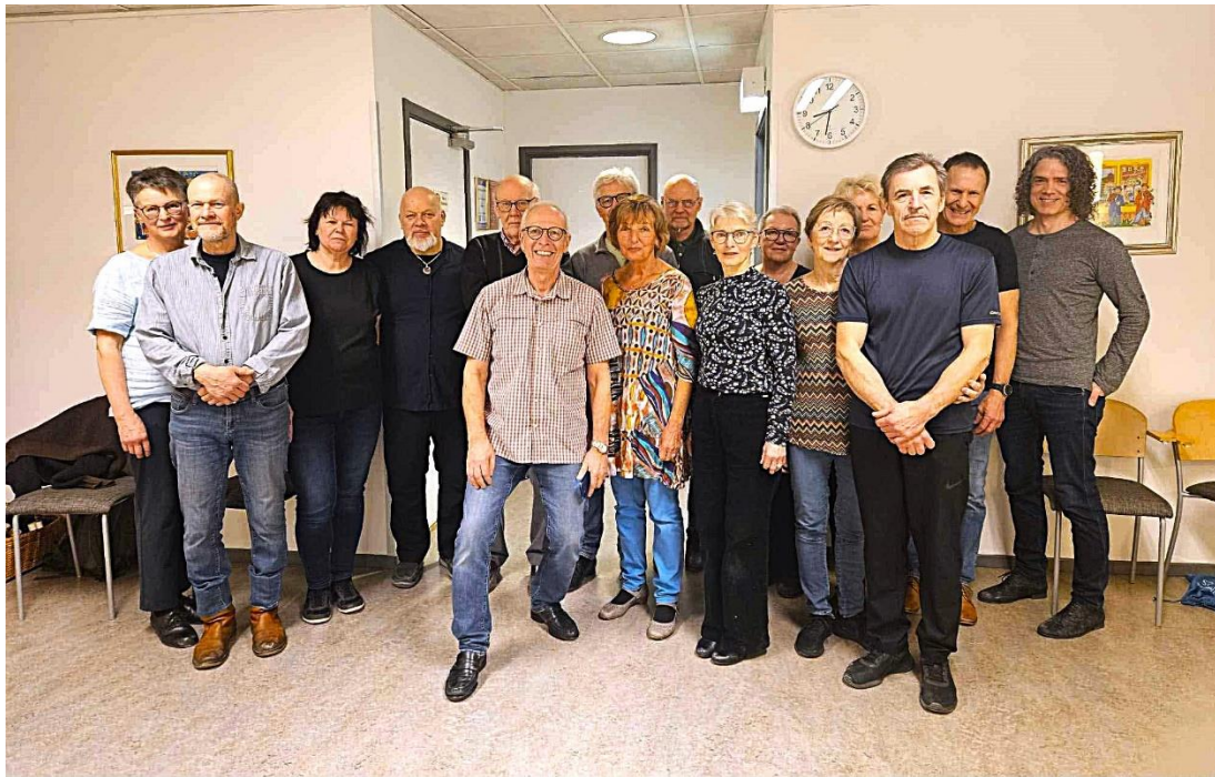
Några av de nya deltagarna på kursen, och några som dansat tidigare.