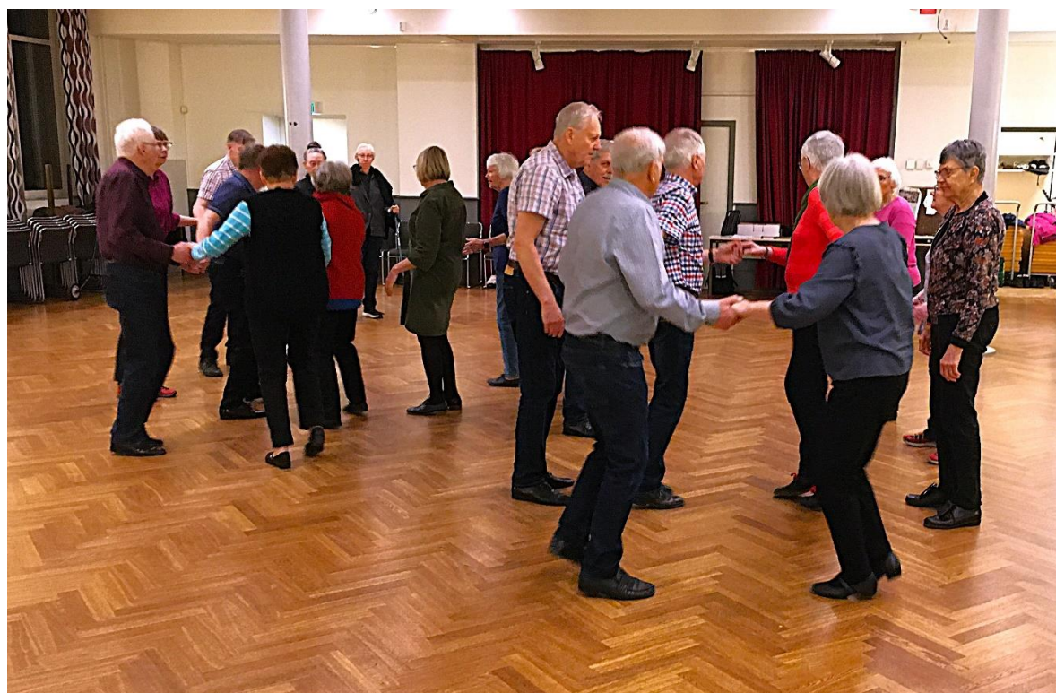
Några som deltog den 6 mars

Vårens "torsdagsdanser" startade den 30 januari.