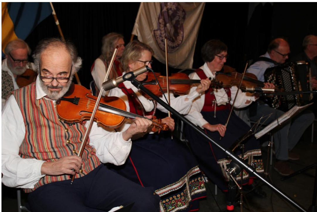
Några av de duktiga spelmän som bjöd på fina låtar.

Lördagen den 18 mars 2023, nästan på dagen åttio år efter bildandet den 17 mars 1943, samlades ca 130 personer, medlemmar, tidigare aktiva och inbjudna gäster, i Risingegården för att fira.