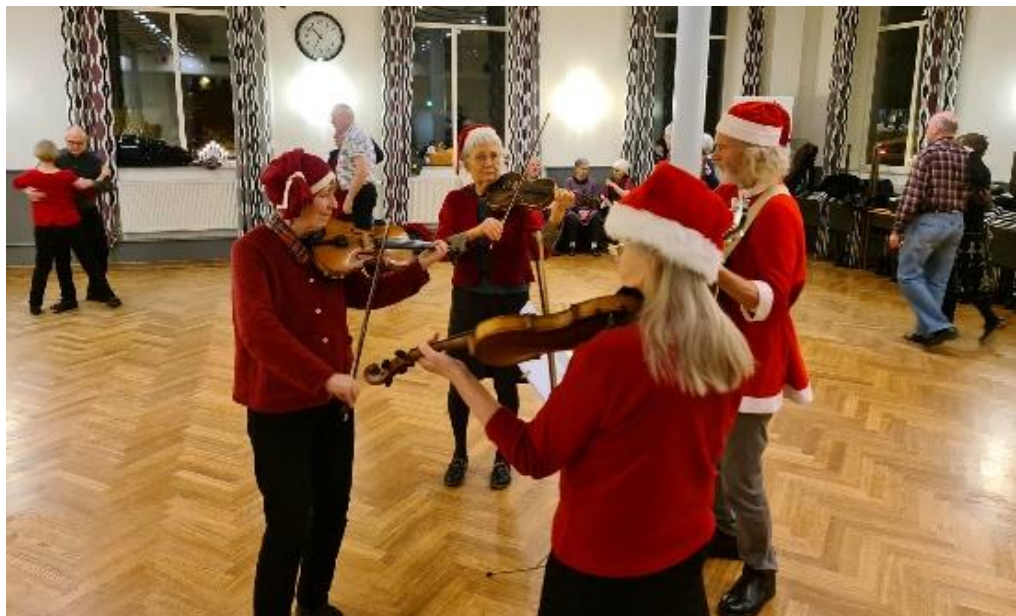
Tomteorkestern spelar vid Polskeavslutningen

När höstens danser avslutades 8 december respektive 11 december, var det lagets spelmän och ytterligare några musiker som spelade. Klubbmästarna serverade glögg med tilltugg.