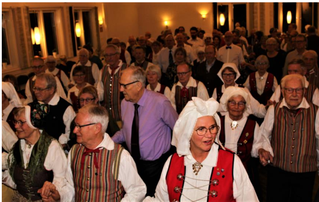
Dansgolvet var fullt vid lagets 80-årsjubileum