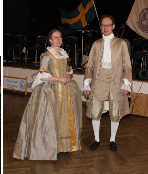
Det bjöds på fina dansuppsvisningar av olika slag under kvällen.