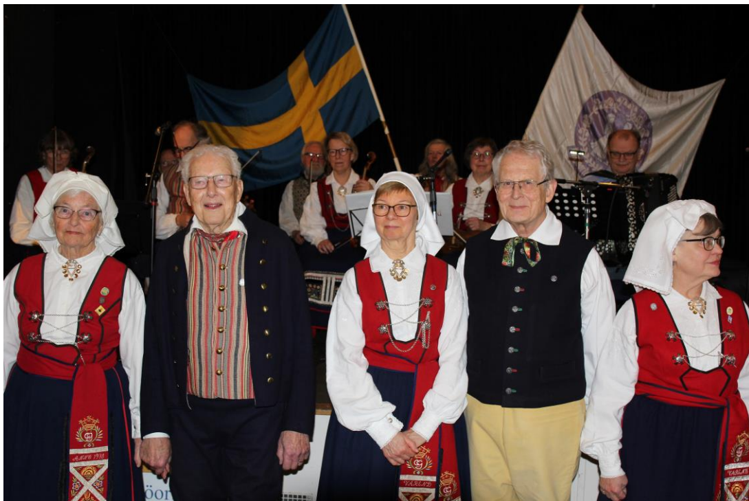
Några av deltagarna uppställda framför spelmännen.