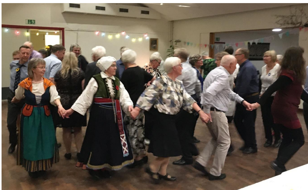
Dansglädje vid O-festen