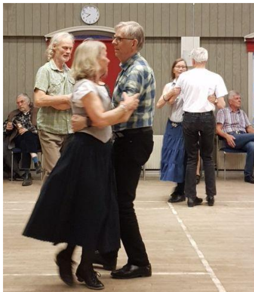
Kvällsdans