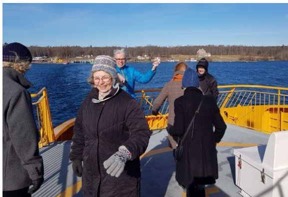
Bakmestråning på färjan hem