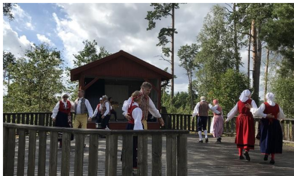
Nyrenoverade dansbanan