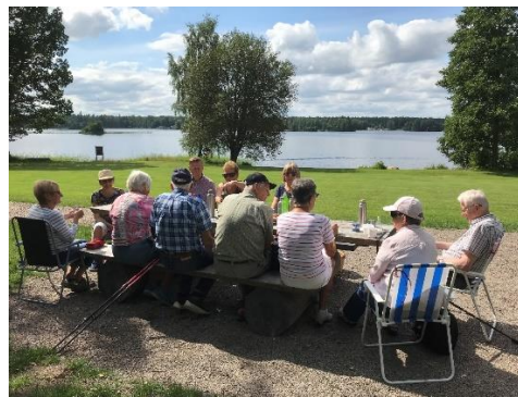
Även sommaren 2021 genomfördes några promenader. Bilder från Ryttartorpet.