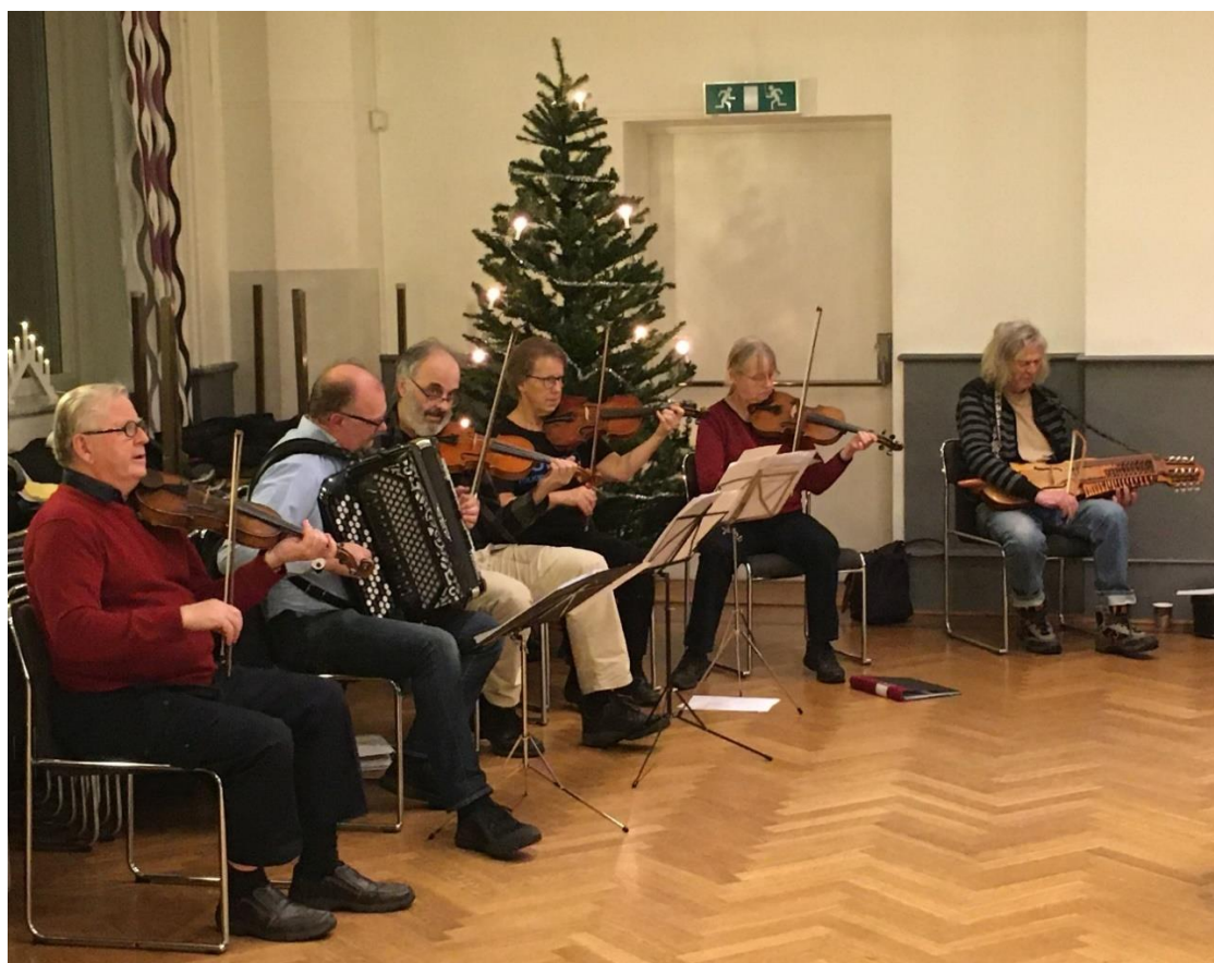
Spelglädje vid avslutning 9 december