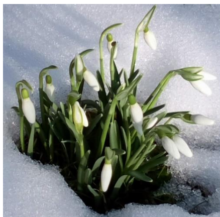
Bild och text - redaktionen eller ordföranden, om inget annat anges.